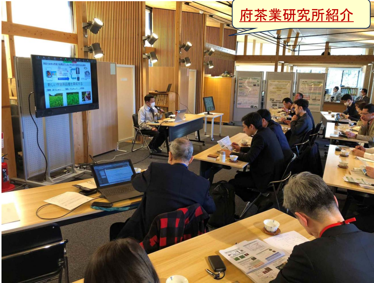
府茶業研究所紹介